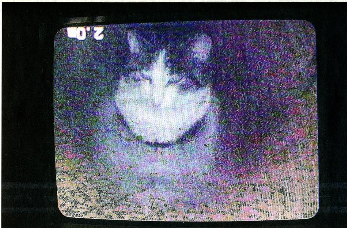
Katze im Kanal: Dank der Kamera kann Mia nach stundenlanger Suche geortet werden

Wenig später reihen sich 14 Mitarbeiter des Starnberger Tierheims und der Feuerwehr Feldafing um