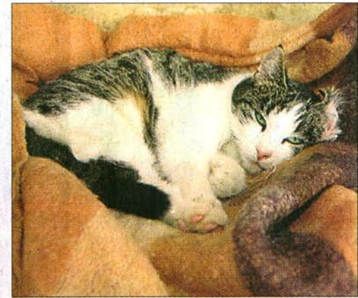
Glück im Unglück: Mia, die nach fünf Tagen Gefangenschaft erstmal ordentlich Futterte.