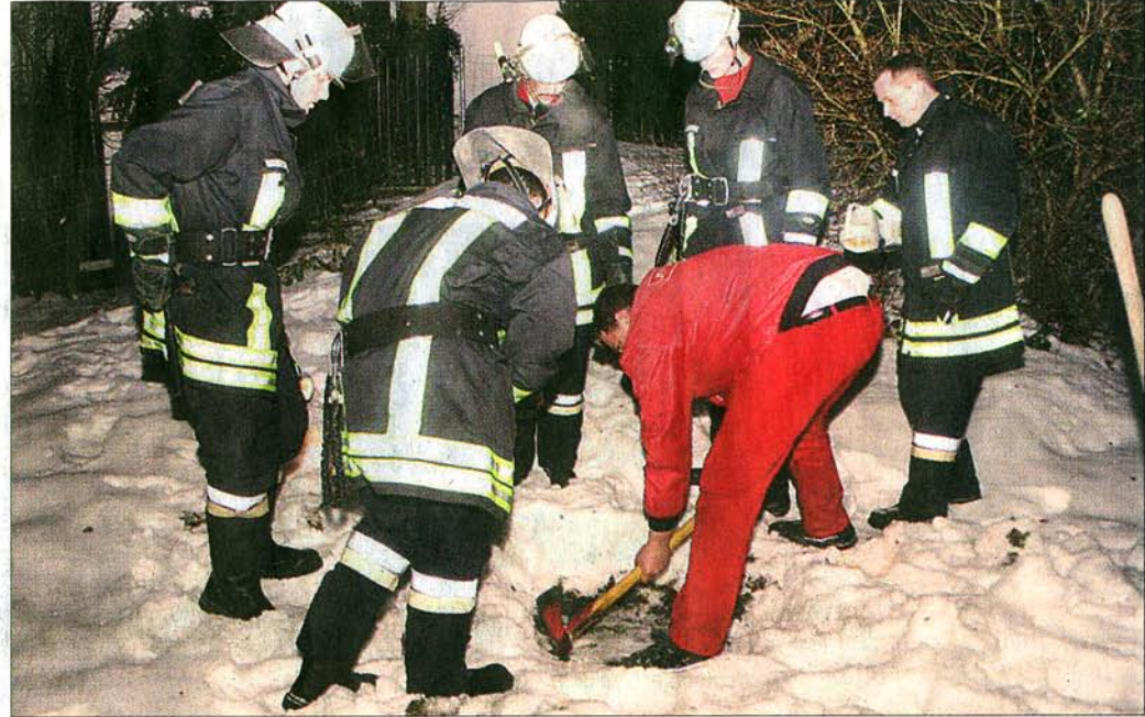
Zehn Männer der Feuerwehr Feldafing retteten die Katze aus ihrer misslichen Lage.