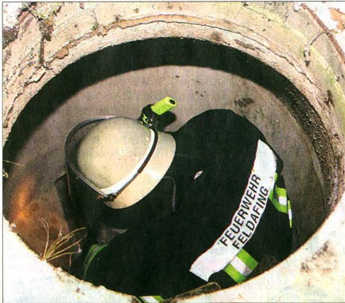
Bis zu diesem Abwasserschacht drängten die Feuerwehrler die Katze, ehe sie sie befreien konnten.